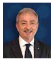
Vice Presidente Vicario ANDI Nazionale