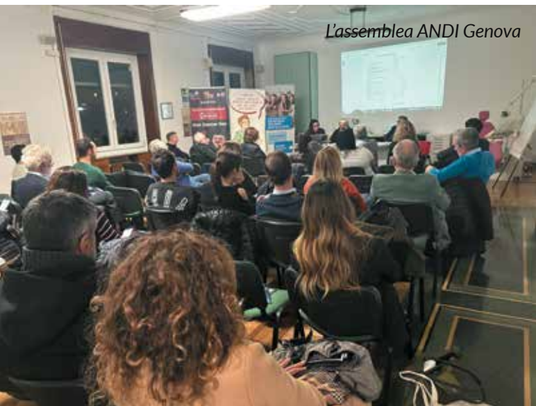
L'assemblea ANDI Genova