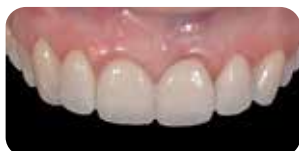
Prova faccette con Try-in Gel