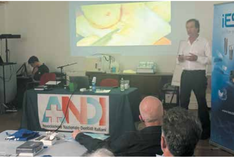
Un momento del Corso Precongressuale

con la loro presenza attenta e partecipata hanno reso vivo e dinamico il congresso, confermando quanto sia forte il desiderio di aggiornamento e crescita nella nostra comunità professionale.