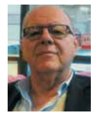
Vice Presidente Vicario ANDI Liguria Presidente Albo Odontoiatri Ordine di Genova