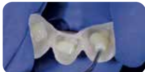
Applicazione Ena Soft Flow per la cementazione dei provvisori