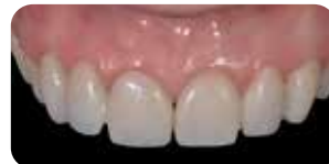
1 settimana dopo: il provvisorio è perfettamente integrato e i tessuti sani