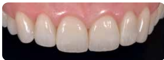
Le faccette in ceramica dopo la cementazione