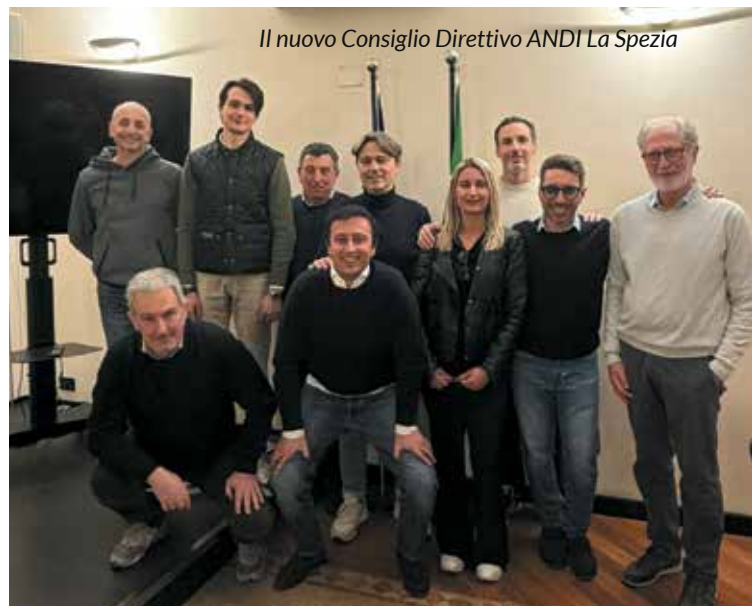
Il nuovo Consiglio Direttivo ANDI La Spezia

Le elezioni del nuovo gruppo dirigente si sono svolte in un clima amichevole, e con una visione condivisa per i prossimi anni.