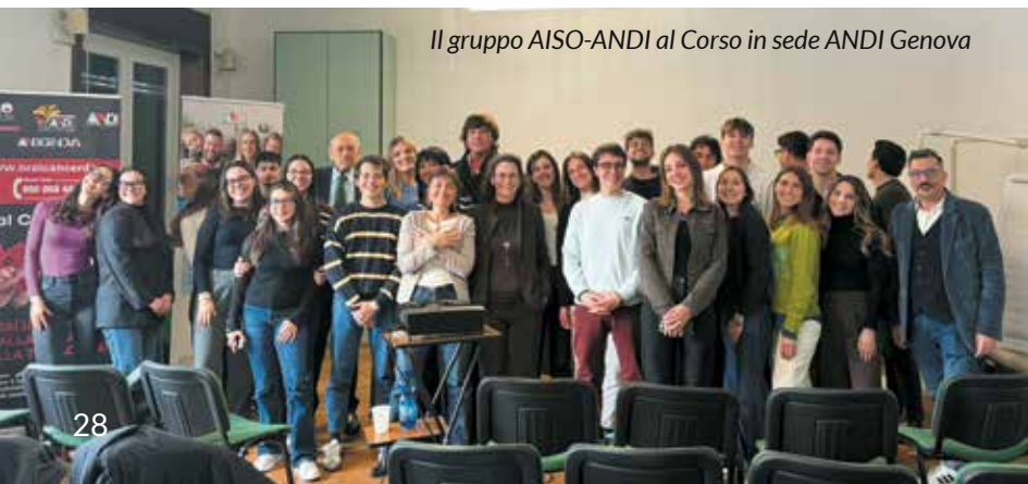
Il gruppo AISO-ANDI al Corso in sede ANDI Genova

In bocca al lupo ai partecipanti: il futuro dell'odontoiatria passa anche da qui.