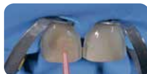
Cementazione faccette: fase adesiva con Ena Bond per 40 secondi