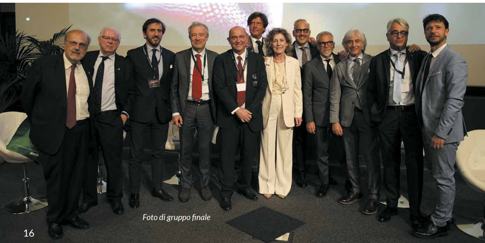
Foto di gruppo finale