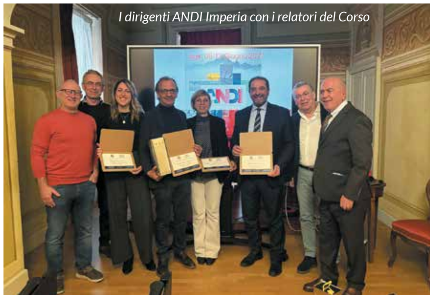
I dirigenti ANDI Imperia con i relatori del Corso

L'evento ha ribadito un messaggio fondamentale: sebbene le raccomandazioni e le linee guida siano la bussola della moderna Evidence Based Medicine, il successo terapeutico e la sicurezza del paziente risiedono sempre nel giudizio clinico del professionista e nella stretta collaborazione interdisciplinare tra medici e odontoiatri.