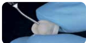
Applicazione Try-in gel nelle faccette in ceramica per prova colore