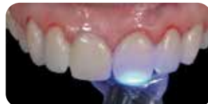
Polimerizzazione per 60 secondi