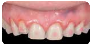
Mordenzatura a spot e applicazione Ena Seal per cementazione provvisoria

Ena Cem HV è un composito flow, fotopolimerizzabile, ad alta viscosità, messo a punto dal Dr. Lorenzo Vanini, che valorizza l'estetica delle faccette sia in ceramica che composito. L'alta viscosità e la alta tissotropia garantiscono una perfetta manipolazione per una facile applicazione e rimozione degli eccessi.