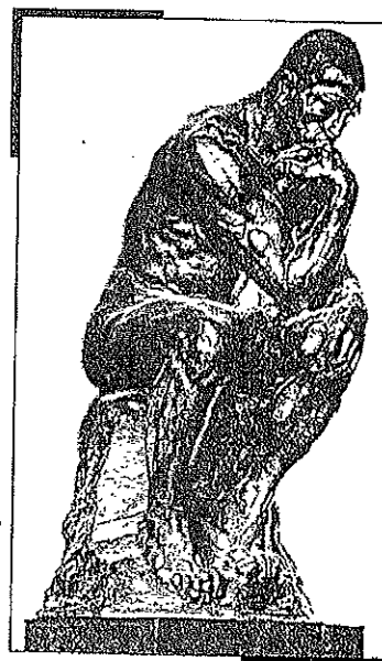
A. Rodin - Il Pensatore